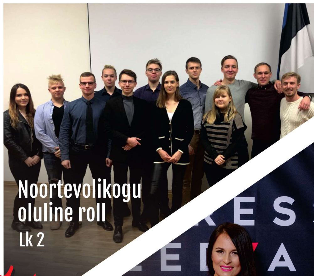
Noortevolikogu oluline roll Lk 2