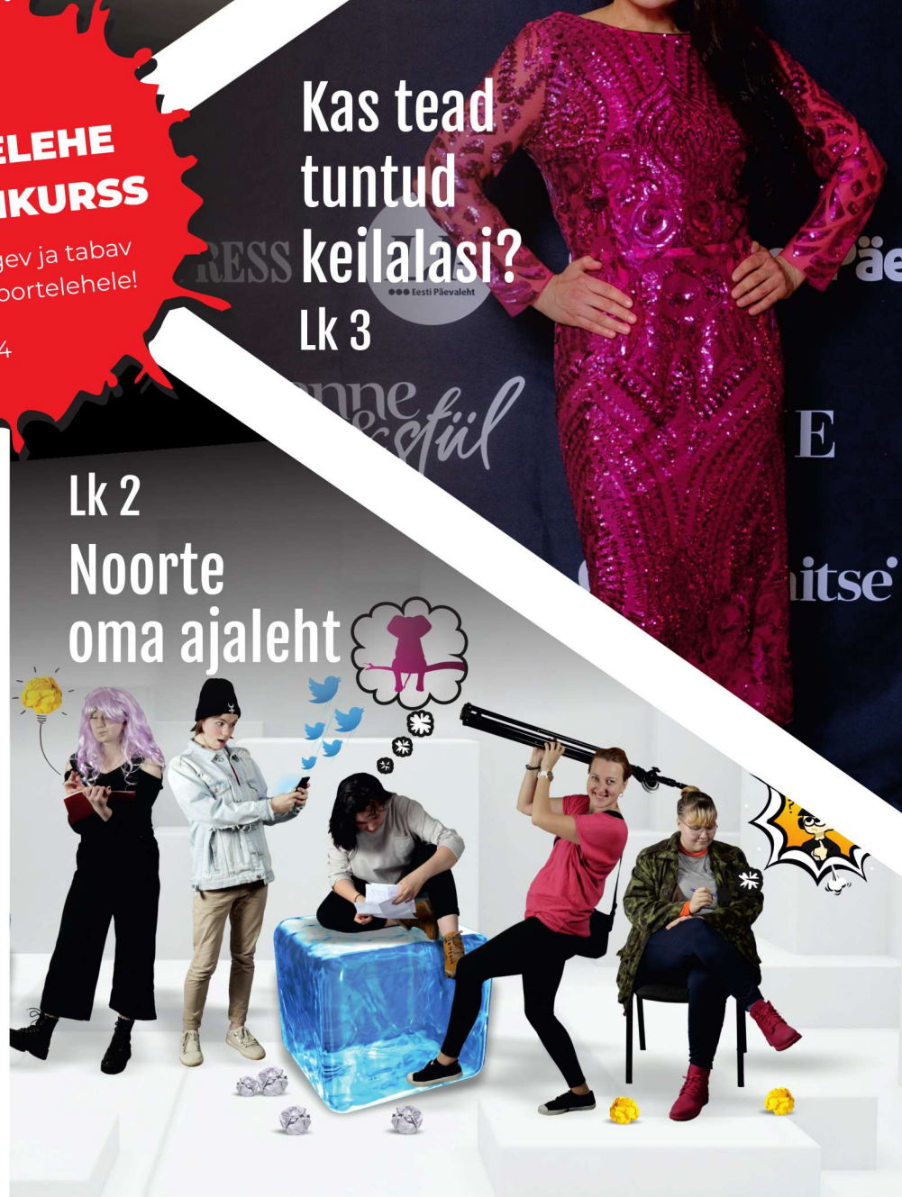
Lk 2 Noorte oma ajaleht