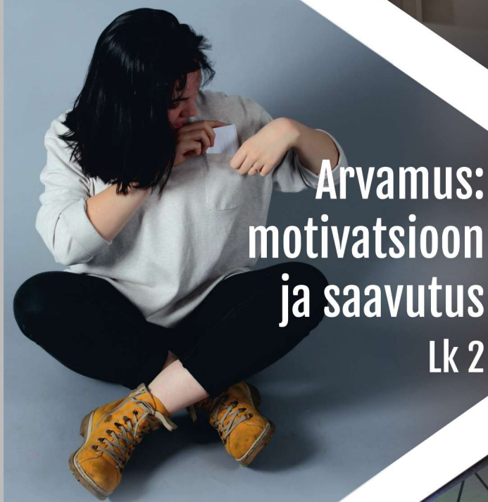
Arvamus: motivatsioon ja saavutus Lk 2