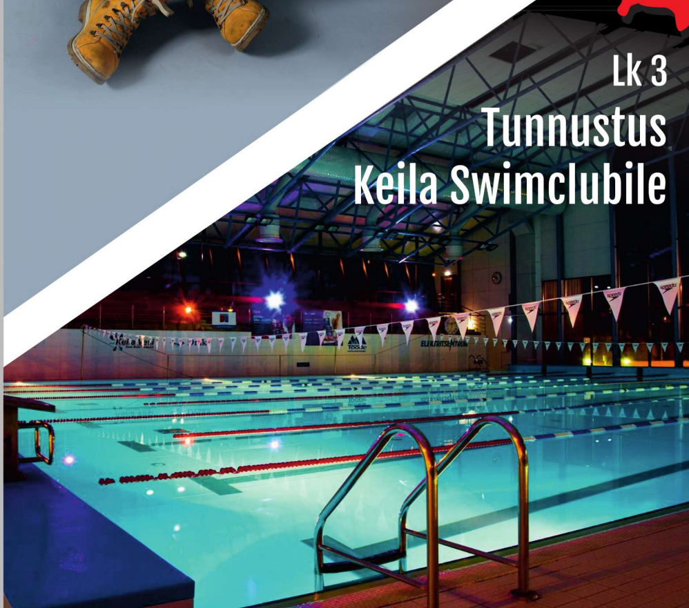
Lk 3 Tunnustus Keila Swimclubile