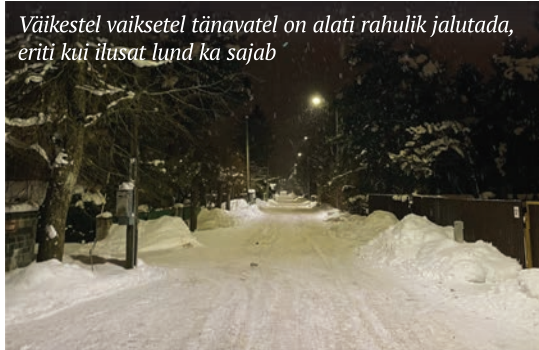
Väikestel vaikel tünnavatel on alati rahulik jalutada, eriti kui ilusad lund ka sajab