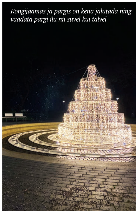
Rongijaamas ja pargis on kena jalutada ning vaadata pargi ilu nii suvel kui talvel