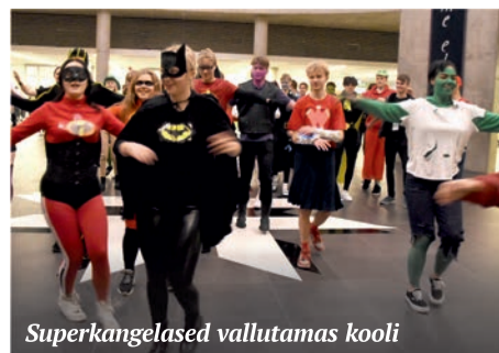
Superkangelased vallutamas kooli