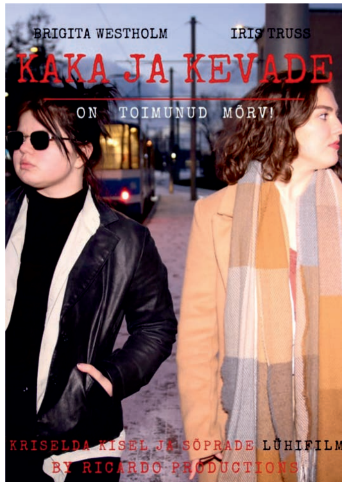
KRISELDA KISEL JA SÕPRADE LÜHIFILM BY RICARDO PRODUCTIONS

Kellel 11. klass alles ees, siis 66. lennu noored soovivad moodulit neile, kellel jagub loovust, tahtejõudu ning ettevõtlikkust.