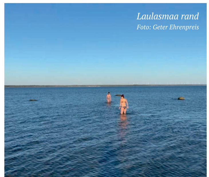
Laulasmaa rand