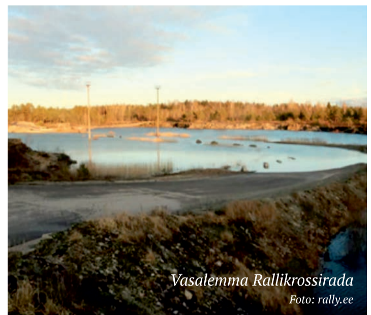
Vasalemma Rallikrossirada