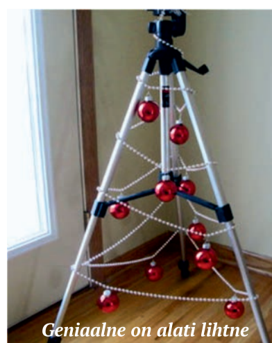
Geniaalne on alati lihtne