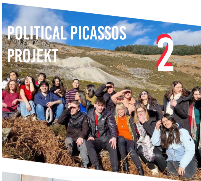
POLITICAL PICASSOS PROJEKT