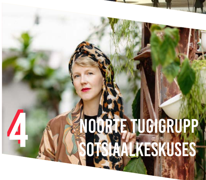
4 NOORTE TUGIGRUPP SOTSIAALKESKUSES