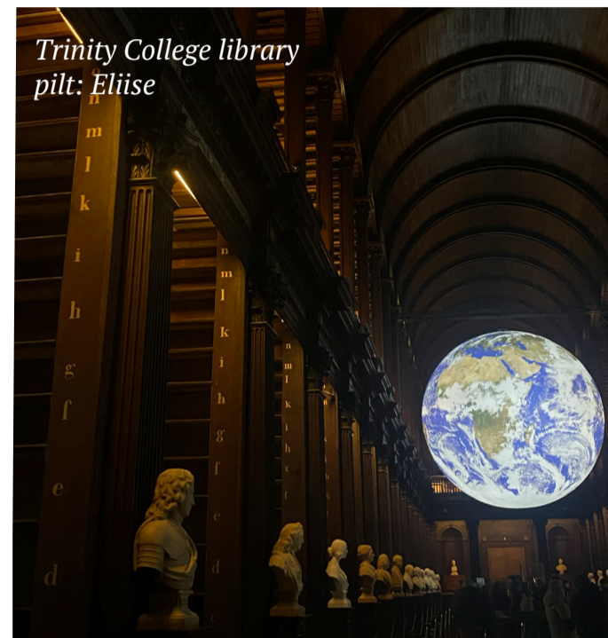
Trinity College library

Eliise Projekt „The Voice of Youth” kannab endas suurt väärtust. Noorte poolt loodud videoid