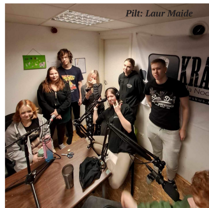
Pilt: Laur Maide