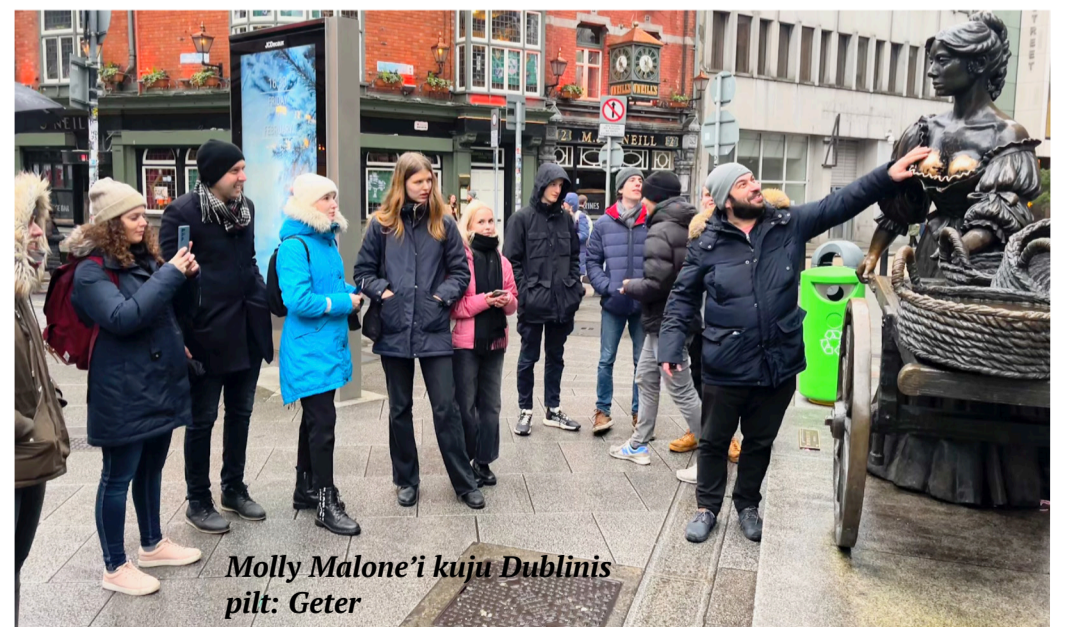
Molly Malone'i kuu Dublinis

Paljud nimetavad laulu „Sweet Molly Malone” Dublini mitteametlikuks hümniks. See räägib Molly elust ja surmast ning seda on aastate jooksul kohandanud ja esitanud paljud artistid. Väi-