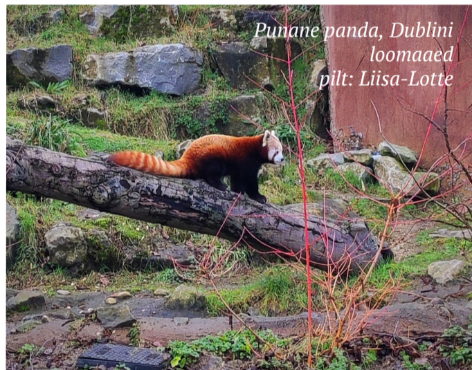
Punane panda, Dublini loomaaed