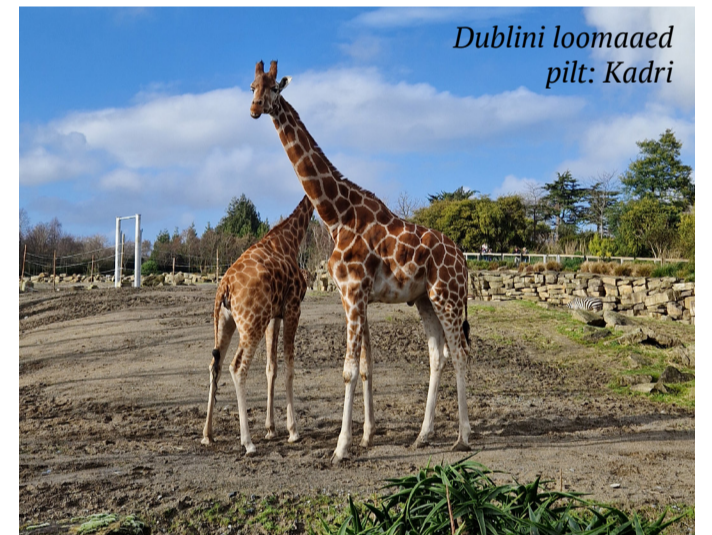
Dublini loomaaed