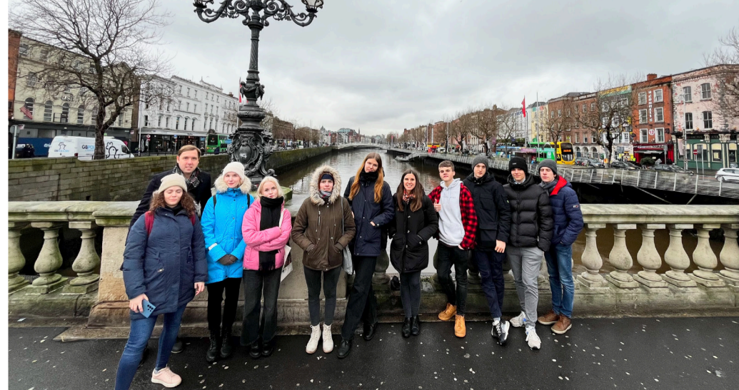
Projektimeeskonnad Ungarist, Iirimaalt ja Eestist

Liisa-Lotte Iirlased on sõbralik ja viisakas rahvas. Piisab vaid sellest, kui hingad kellegi läheduses, ning juba öeldakse sulle alandlikult „Sorry, luv”. Iiri aktsent on kohati naljakas ja segane, vahepeal oleks tahtnud reaaltõlkida