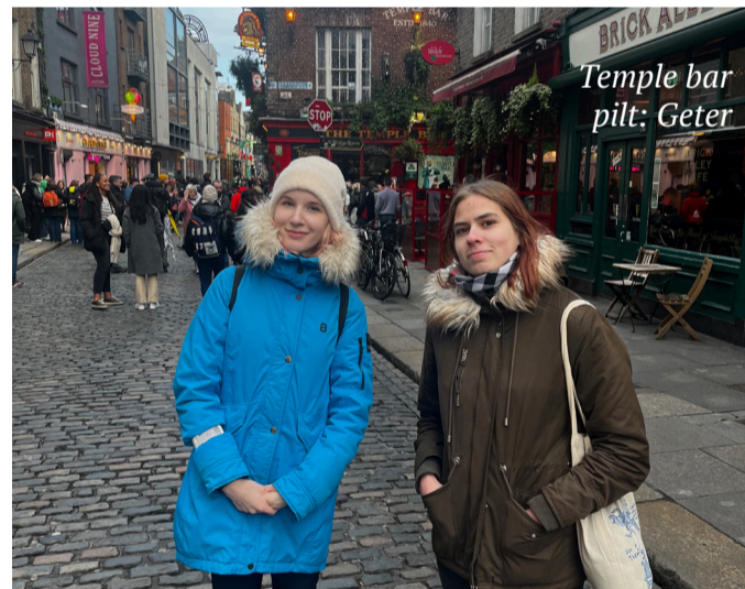
Temple bar