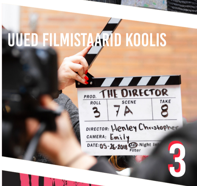
UUED FILMISTAARID KOOLIS

PROD. THE DIRECTOR ROLL SCENE TAKE 3 7A 8 DIRECTOR: Henley Christopher CAMERA: Emily DATE: 05-26-2018 Day-Night In Filter