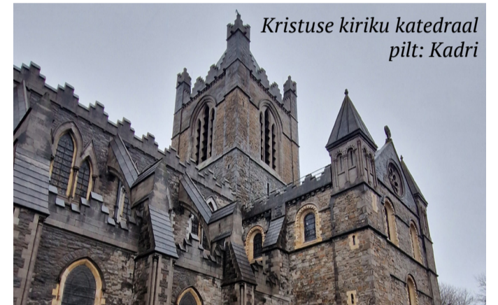
Kristuse kiriku katedraal