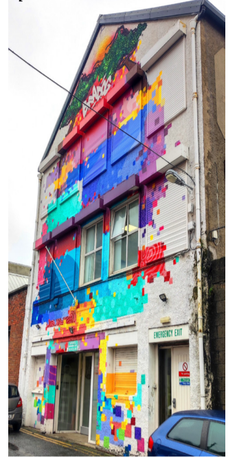
Noortekeskus Dublinis

Välja arvatud kerge tagasilöök Dublinisse minekul, sujus reis ideaalselt. Nende kolme päeva jooksul külastasin ma Dublinile kõige iseloomulikumaid kohti ja tutvusin mitmete kohalike kui ka turistidega. Minu meelest oli see aeg täiesti piisav, et Dubliniga tuttavaks saada. Kindlasti igatsen ma tänaval naeratavaid inimesi ja super viisakaid poemüüjaid.