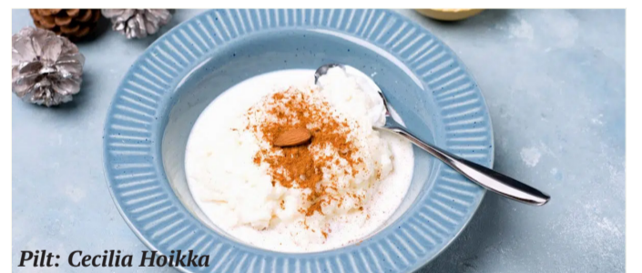
Pilt: Cecilia Hoikka

üksteisele häid jõule. Keskmine missa, millele järgneb ilutestik, on võimalus kohtuda naabrite ja kaugemate sugulastega ning soovida neilegi häid pühi. Portugali jõululaul on tihti toiduks tursk kartulite ja köögiviljadega või hoopis näiteks kaheksajalg.