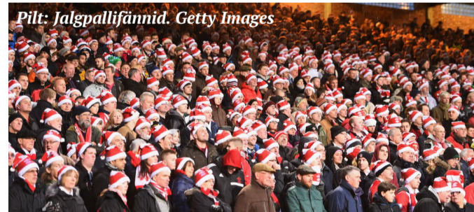
Pilt: Jalgpallifännid.

Jõuluõhtul on kombeks katta külmlaud ning esimesel jõulupühapäeval on traditsiooniliseks roaks laual kalkun. 26. detsembril on aga Boxing Day ning sel päeval toimuvad üle riigi jalgpallimatšid, kus osalevad kõik riigi jalgpallimeeskonnad. Jalgpalli minnakse vaatama staadionile kui ka kodus teleri ette. Lisaks korraldatakse sel päeval hobuste võiduajamisi, mida minnakse samuti peredega vaatama.